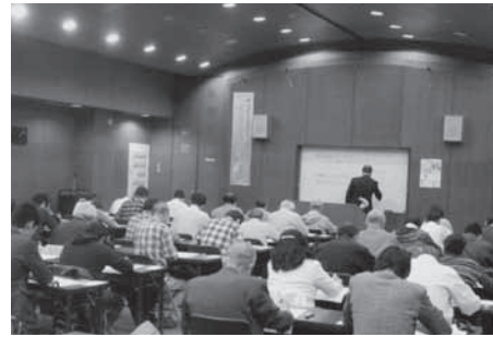
昨年度の試験の様子

今年で6回目となる日立市のご当地検定「ふるさと日立検定」の試験日が11月15日(土)に決定しました。 ふるさと日立検定は、「日立市にはたくさん魅力的なものがあるのに知られていない」「郷土としての誇りや文化を知ってほしい」という流れをつくりたい」という考えから、幅広い年代層に、またより多くの方に郷土の魅力を知ってもらおうきっかけとしてできた事業で、これまで700人以上が合格されています。