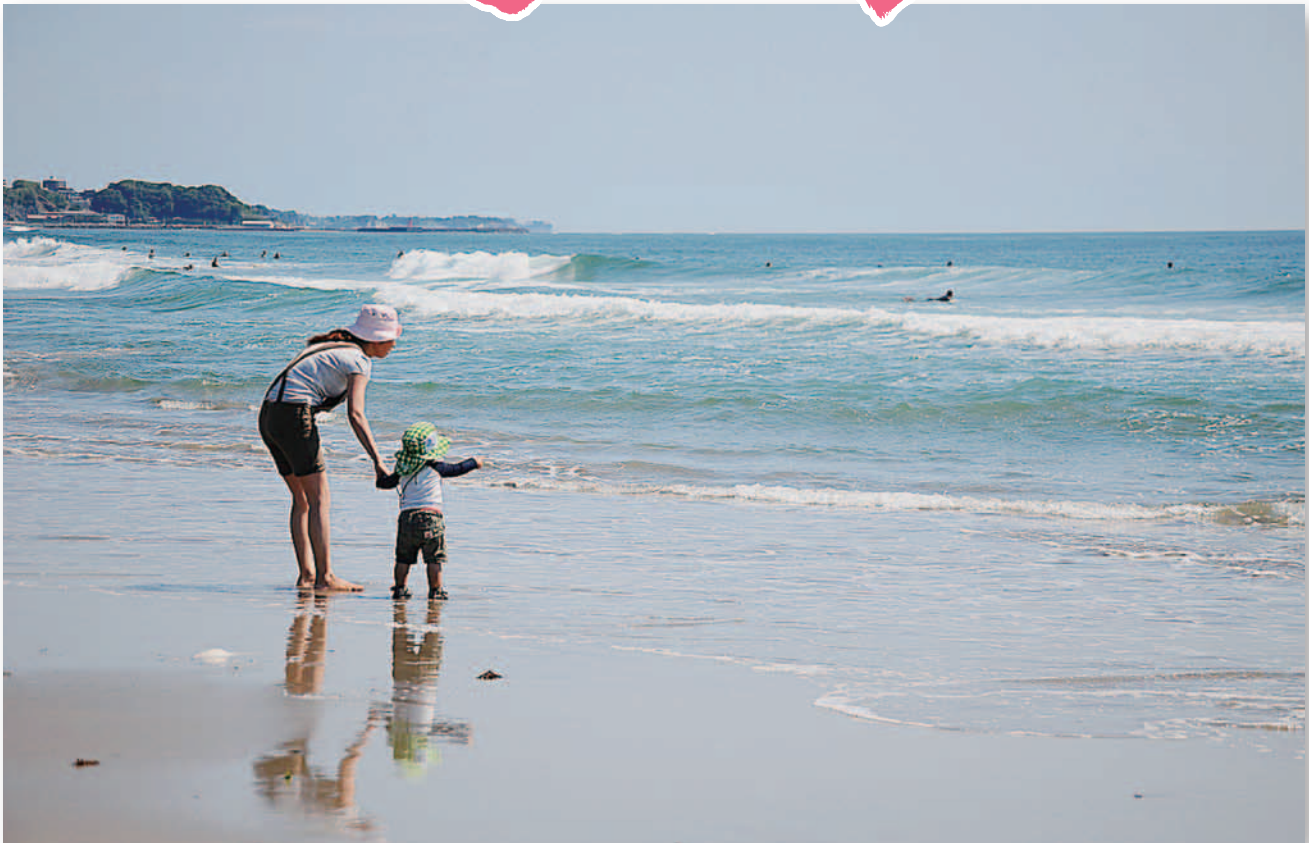
今年も市内海水浴場の水質は良好!!(水質判定基準適・可) 伊師浜(A)川尻(A)会瀬(B)河原子(A)水木(AA)久慈浜(AA)