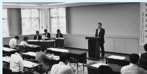
融資制度説明会 日本政策金融公庫、茨城県、日立市、茨城県信用保証協会担当者から各金融制度の説明を受ける。