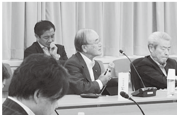
潜在成長率引き上げの重要性を指摘する三村会頭(中央)

世耕弘成経済産業大臣は、「今こそ企業の投資の拡大と消費を喚起するための賃上げ促進に向けて呼び水となる政策を総動員する時が来ている」と強調。ロボットや人工知能など第4次産業革命に向けた投資とともに、中小企業の活性化を通して、GDP 600兆円を目指す考えを示した。