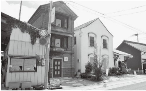
常陸太田市鯨ヶ丘商店街

今回は観光委員会と合同で参加者19人で視察研修会を行ない、9月17日から公開されている『KENPOKU ART 2016 茨城県北芸術祭』の会場をバスで巡り視察しました。視察の出発にあたり情報化委員会(武田委員長)は「作家たちが何ヶ月もかけ県北に足を運び、この地の歴史と自然にインスピレーションを受けて制作したものであり。決して東京など他所で作ったものを持ち込んではいない