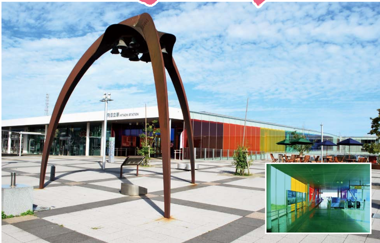
かいぎしよ NEWS新年号企画で当所役員・議員の選んだ日立市内の好きな場所(その⑦)：日立駅舎 現在茨城県北芸術祭が行われており、ガラスの日立駅舎の壁面が虹色のカッティングシートで彩られています。