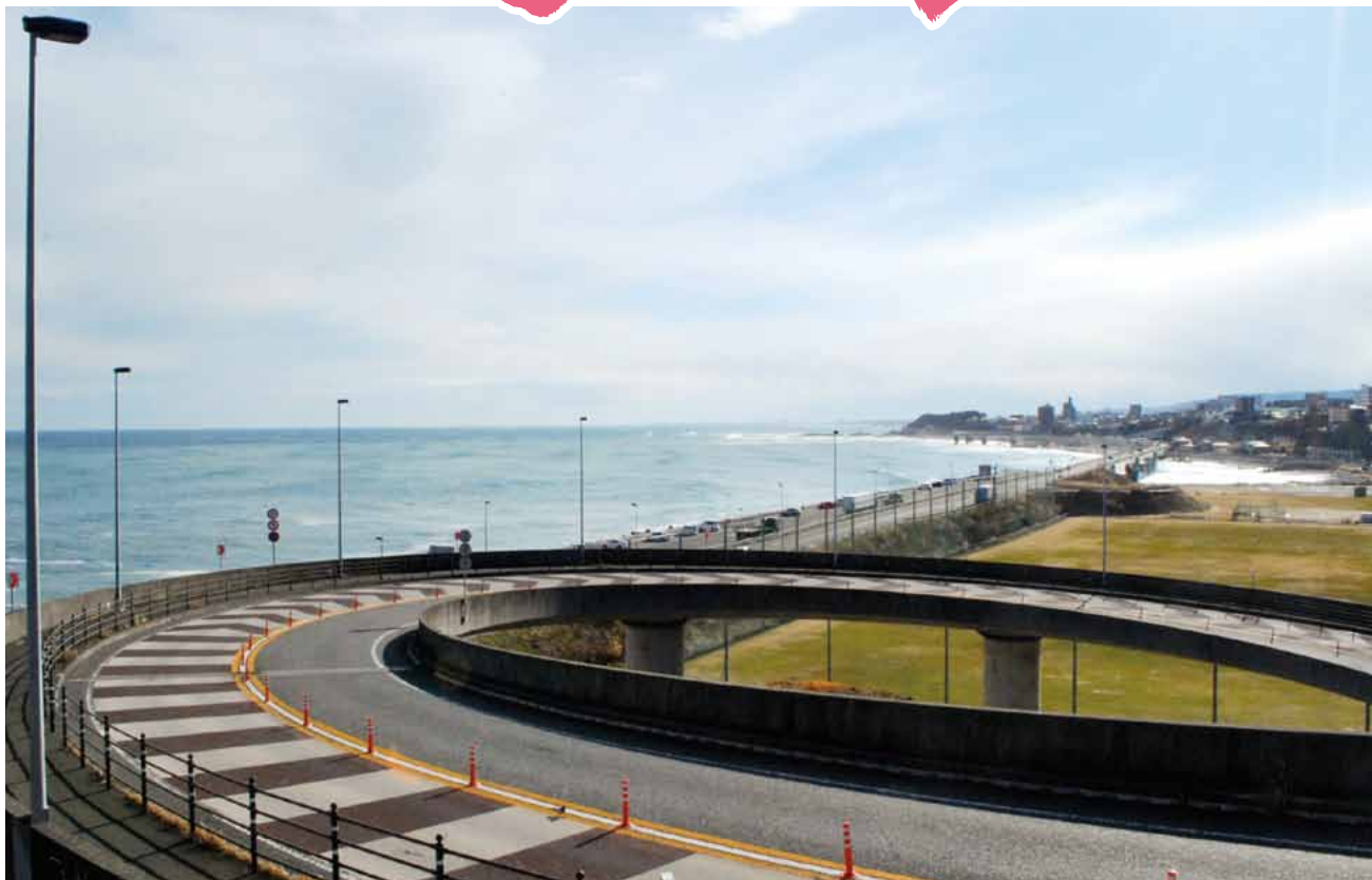
かいぎしよ NEWS新年号企画で当所役員・議員の選んだ市内のお勧めの場所(その⑩) ：浜の宮らせん橋と6号バイパス 国道6号バイパスと市街地(東町)を接続するらせん橋。