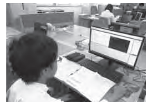
毎年2年生が全員職場体験を行っています