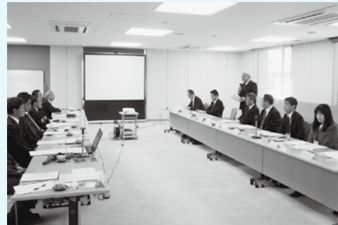
金融財務業部会視察研修(2.10) 桐生商工会議所理財厚生部会と商工会議所の現状や部会事業について懇談し、桐生新町重要伝統的建造物群保存地区を視察する。