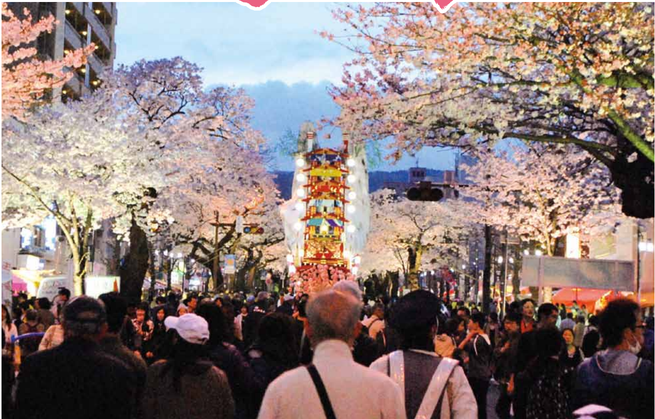
かいぎしよ NEWS新年号企画で当所役員・議員の選んだ市内のお勧めの場所(その⑩) 平和通りのさくら(写真は去年のさくらまつり：関連記事④面掲載)