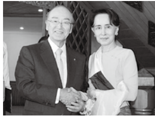
握手するスー・チー国家最高顧問(右)と三村会頭

日本商工会議所は1月22～28日、三村明夫会頭を团长とする「訪ベトナム・ミャンマー経済ミッション」を派遣した。ミッションでは、ベトナムのグエン・スアン・フック首相、ミャンマーのアウン・サン・スー・チー国家最高顧問やティン・チョウ大統領らと会談。経済関係強化、ビジネス・投資環境改善などについて意見交換を行った。