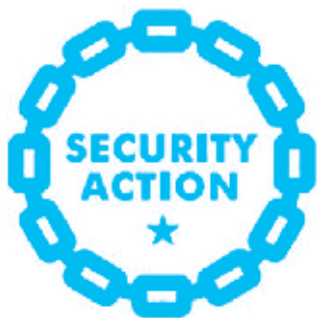
セキュリティ対策自己宣言

セキュリティ対策は費用対効果が明確ではないためコストとして考えられることが多い。しかし、事例集では、取り組みを対外的にアピールすることで信頼獲得につながった、従業員のセキュリティ意識向上など人材育成につながったという経営者の声も多い。経営者がリーダーシップを発揮して対策を推進した企業ほど効果を実感しているようだ。