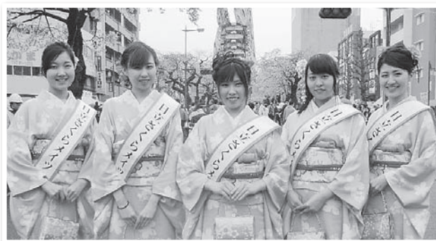
現在のさくらメイツ