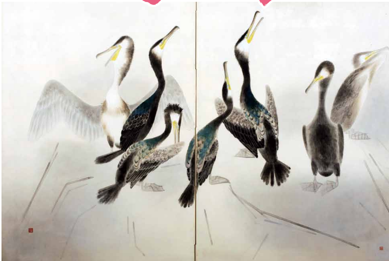
日立市内の芸術作品③ 櫻村 白圭《鵜》 1965年頃 日立市郷土博物館蔵 十王町山部出身の櫻村白圭は、昭和初期から日本美術院に作品を発表していた日本画家です。