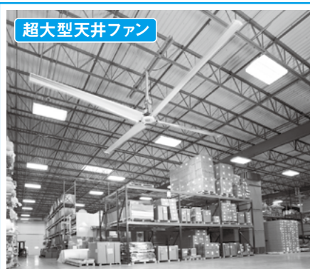
超大型天井ファン