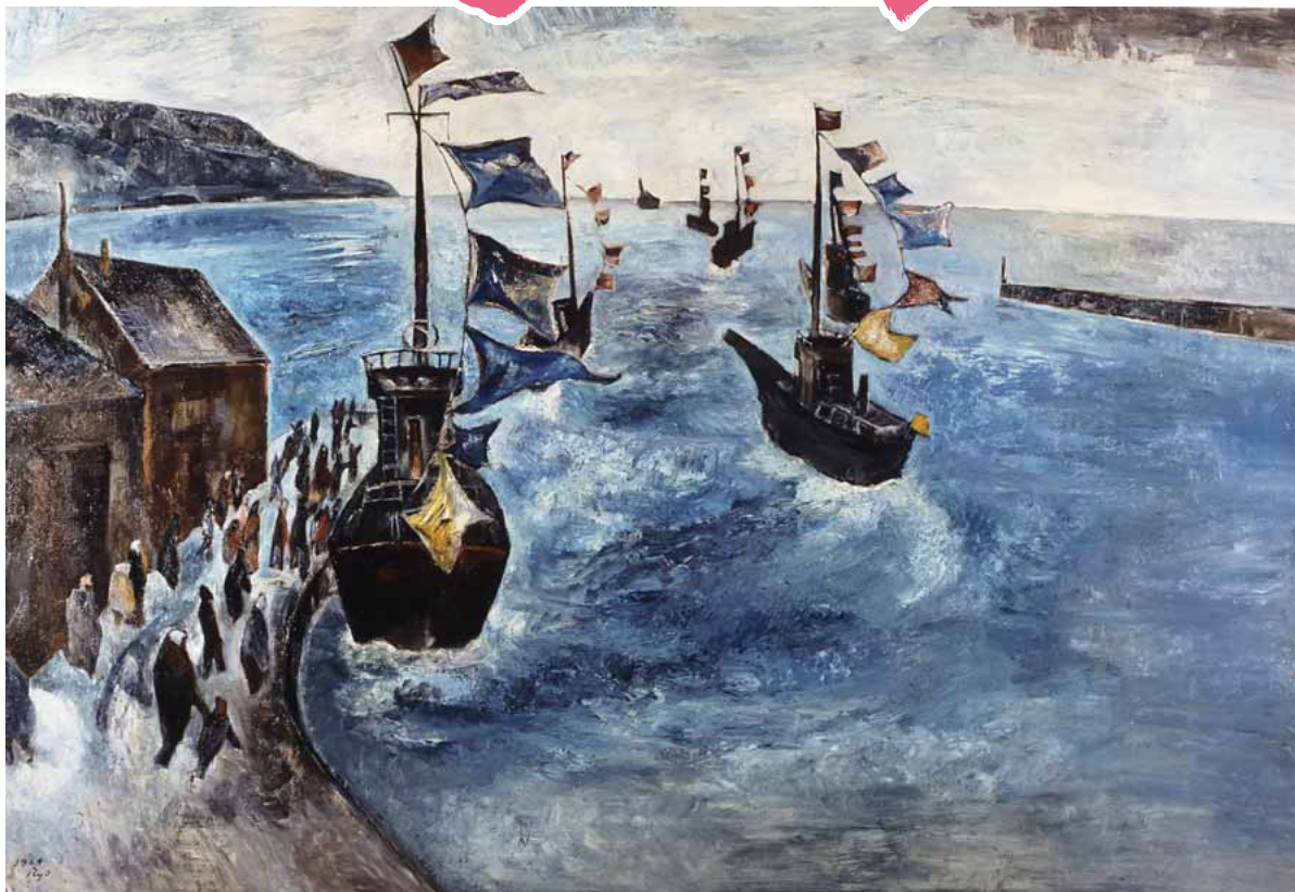
日立市内の芸術作品⑩ 田中 良《船出》1964年 日立市郷土博物館蔵 田中 良(1923年旧真壁町生まれ、二科会理事長)は北海道の湿原を描いた作品で知られる洋画家です。