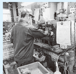
今年度は12名の生徒が受入事業所9社で実習を行っています。