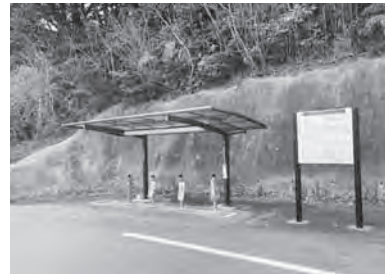
日立滑川温泉スタンド

ち帰り、家庭で楽しむことができます。また、近隣商業施設「SEA MARK SQUARE」の屋上広場には、日立滑川温泉の足湯があり、気軽に温泉に親しむこともできます。