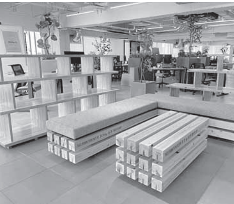
カーボンストックファニチャー。 日立市ゼロカーボンアクション表彰