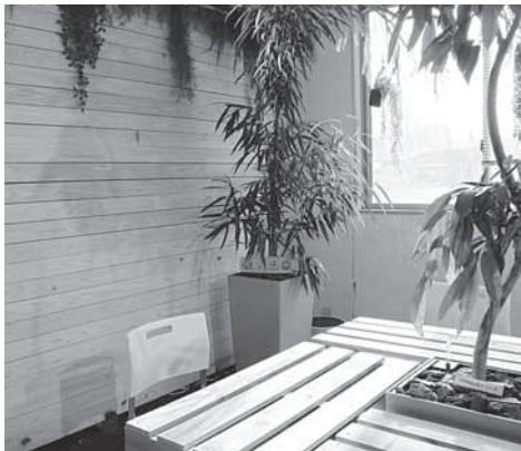
S.P.エンジニアリング(株)オフィス内の木質化リノベーション