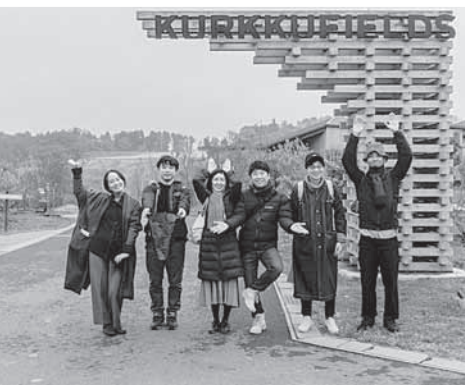
新社屋プロジェクトには、今後の事業運営にもつながるメンバーを県外から迎える。

全国の森林では、伐採が必要な時期になっているにもかかわらず、林業での人手不足や、資材に活用されないことで荒廃してきている現状があります。一方で、木材業界では、林業、製材業、木材市場、木材卸売業、住宅業が分断され、課題が認識さ