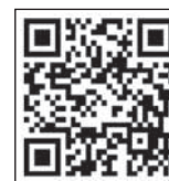
事業者支援制度 説明会