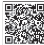
事業者向け 支援制度一覧

また、上記の補助制度も含めて、令和6年度に実施する国や市の事業者支援施策についての説明会を以下のとおり開催いたしますので、ご関心のある方は是非ご参加ください。