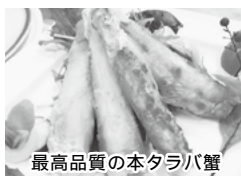
最高品質の本タラバ蟹