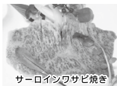
サーロインワザビ焼き