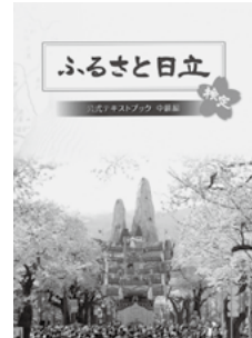
公式テキストブック発売中 各1,000円(税込)