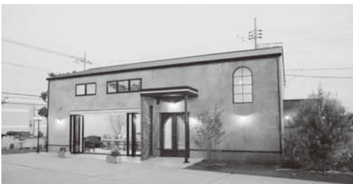
昨年完成した多目的スペース『ランプルージュ』