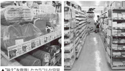
▲“映え”を意識したカラフルな容器 手前は内外で柄の違うスイカ柄 ▲様々な販促グッズも揃います