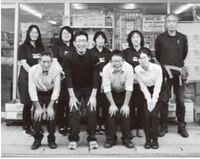
▲写真:齊藤さん(前列左から2人目)と日立営業所の皆さん