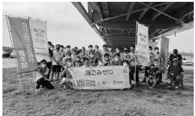
海ごみゼロウィーク2021