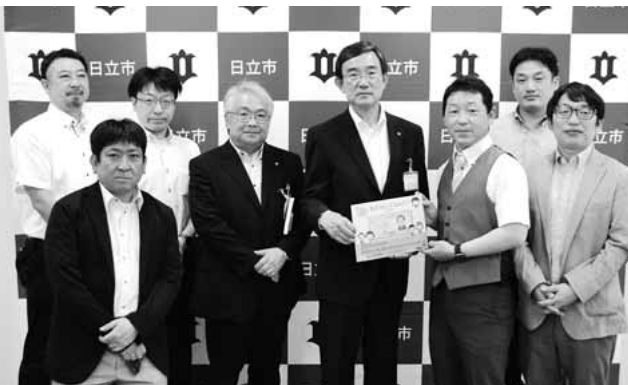
絵本「おかねってなあに？」寄贈

4月の通常総会で会長を仰せつかり、早いもので半年が経ちました。昨年度に引き続き、コ