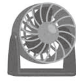
サーキュレーター