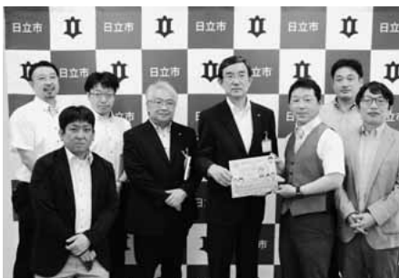
絵本「おかねってなあに？」寄贈