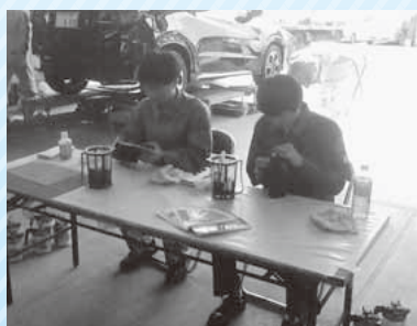
昨年は緊急事態宣言により中止、一昨年は72名の生徒が会員企業20社で職場体験。