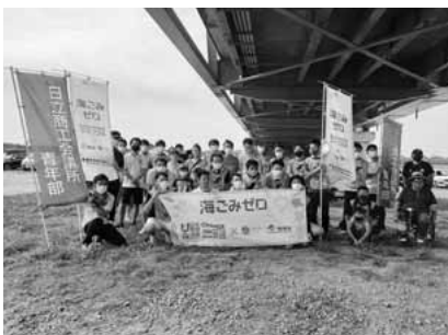
海ごみゼロウィーク2021