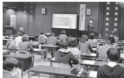
商業・観光環衛業部会 「スマホビジネス活用セミナー」