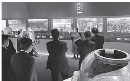
工業・金融財務業部会 「日立オリジンパーク見学会」