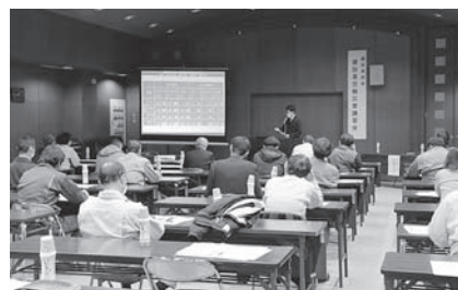
建設業部会 「労働衛生講習会」