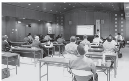
情報化委員会 「サイバーセキュリティ講習会」