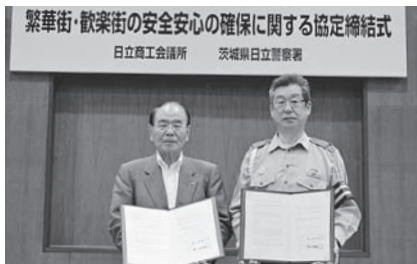
繁華街・歓楽街の安全 安心の確保に関する協定