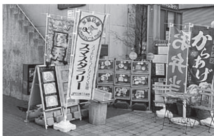
観光環衛業部会 「ぐるっとひたち飲食店スマスタラー」