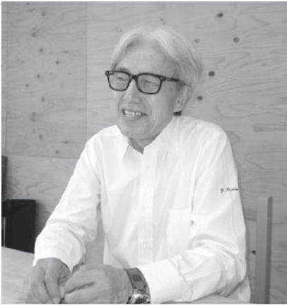
星野税務会計事務所