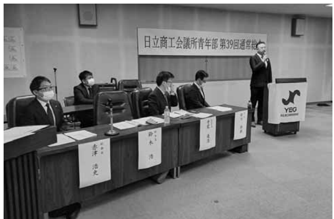
日立商工会議所青年部第39回通常総会