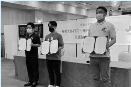
災害協定調印式事業

また、新型コロナウイルスの影響の長期化も懸念される現状ではありますが、地域を支える青年経済団体として、微力ながら日立市に貢献して参りたいと思っておりますので変わらぬご支援をよろしくお願い致します。