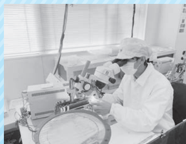
昨年は80名の生徒が会員企業25社で職場体験。