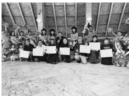
第8回常陸ノ国グルメフェス