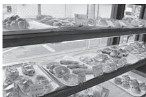
午前中が種類多めです

店内に焼き立ての調理パンや菓子パンを陳列すると、お客様の一人がそれを見て「パステリア(たくさんの小さいケーキを並べたスペース)のケーキ店(のよう)だ」と、喜ぶ言葉にひらめき、店名を『パステリア』にしました。『パンとワインの』 「パンとワインの」 「マリアージュも探求」 パンの食感や風味を決める酵母や作業工程には強いこだわりがあり、用途別の生地は10種類以上を数えます。そのため毎日、多種多様なパンを焼くことができます。さらに20年前には親交を深めていたフランス料理と、イタリア料理の複数のシェフから刺激を受け、ソムリエの資格を取得。パンとワインの相性、マリアージュを求め、同店2階にワインバーを開設しました。ワイン好きの間で評判になりましたが、早朝に仕込み