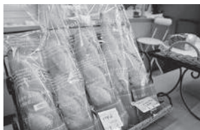
フランスパンは2種類