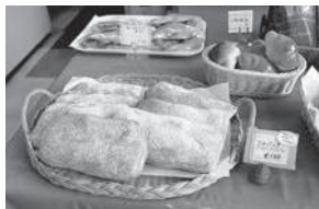
イタリアのパン「シャバッタ」