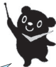
最低賃金制度のマスコット チェックマン

*年齢やパート・学生・アルバイトの働き方の違いにかかわらずすべての労働者に適用されます。