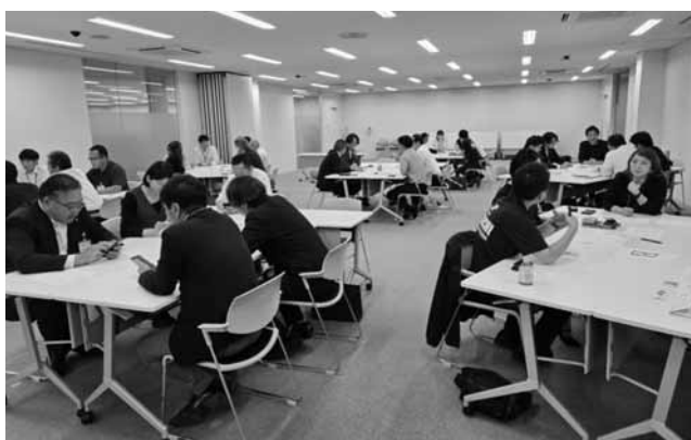
日立商工会議所 9月例会「日立市職員との交流会」 日立市の将来像について意見を交わしました。