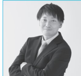
令和7年度 青年部会長

日本商工会議所青年部(YEG)の「関東ブロック大会」は、関東エリアのYEGメンバーが一堂に会する年に一度の大規模イベントです。各地との交流を深め、研鑽を積む機会として、関東ブロック圏内88青年部が持ち回りで開催し、令和8年は日立市での開催が決定しました。大会では、テーマ別の研修や見学、体験型プログラムなど、毎年多彩なプログラム(分科会)が組まれます。青年部メンバーは日々の業務と並行しながら、大会成功に向け、準備に奔走しています。本記事では、大会に向け準備を進める様子や大会に向けた想いを、メンバー自身に語っていただきます。