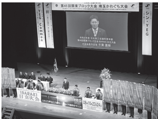
関東ブロック大会 PRキャラバンの様子

また、青年部ならではのネットワークづくりの場でもあり、志を同じくする仲間との出会いは、今後の活動やビジネスにも大きな財産となります。関東という広いエリアの中で、多様な業種や地域で活躍する青年経済人が集うことで、新たなつながりや可能性が生まれることも、この大会の大きな魅力の一つです。