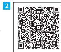
過去のガイドブック